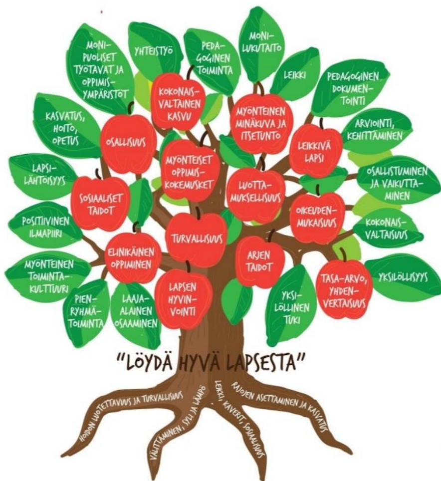
Kuva: Pyhäjoen varhaiskasvatuksen arvot, menetelmät ja tavoitteet.